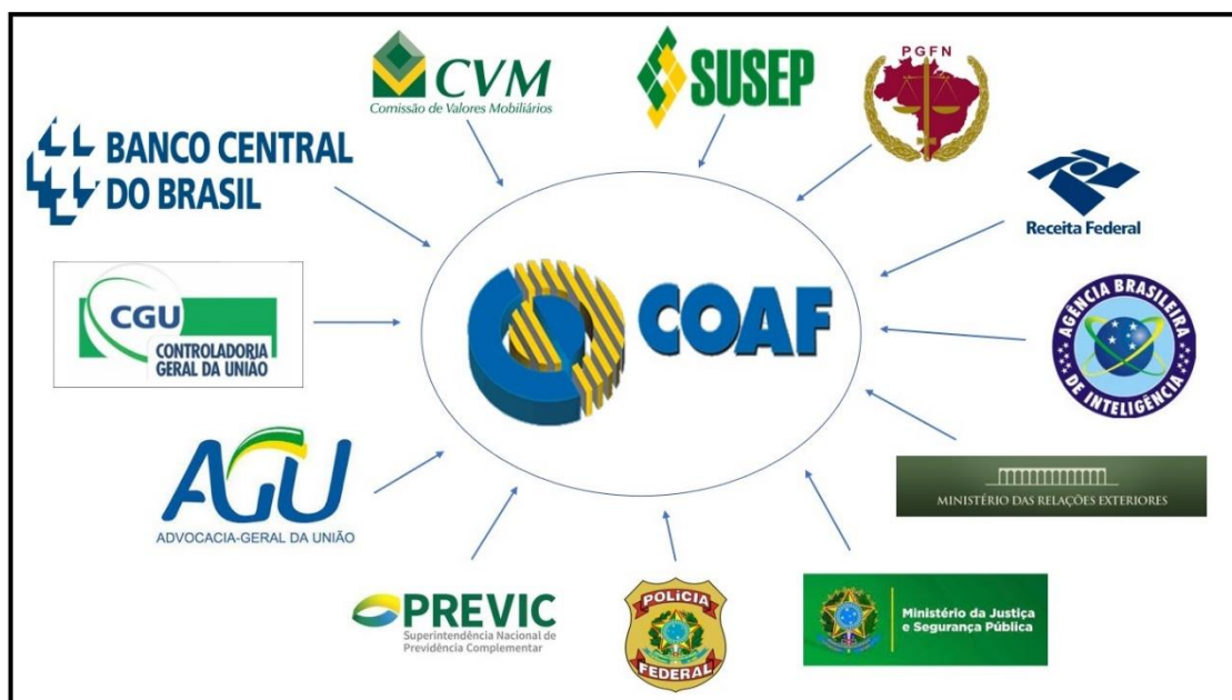
Figura 4 – Órgãos e Entidades

De acordo com o inciso I, do art. 4º, a Lei nº 13.974, de 07/01/2020, que reestrutura o COAF, o plenário é composto por servidores ocupantes de cargos efetivos, de reputada ilibada e reconhecidos conhecimentos em matéria de prevenção e combate à lavagem de dinheiro escolhidos dentre integrantes dos quadros de pessoas dos seguintes órgãos e entidades mostradas na Figura 4: