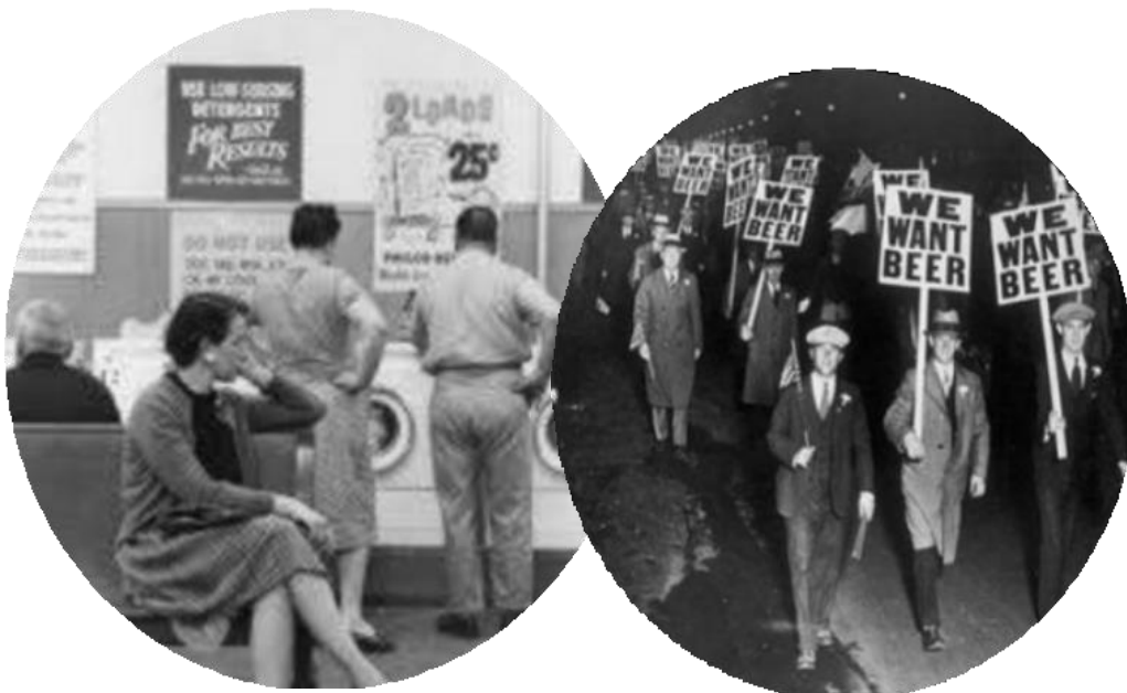
Figura 1: Lavadeira e protesto contra a Lei Seca

Uma origem lendária leva a Al Capone que teria comprado em 1928, em Chicago, uma cadeia de lavanderias ( laundromats ), da marca Sanitary Cleaning Shops . Esta fachada legal ter-lhe-ia permitido fazer depósitos bancários de notas de baixo valor nominal, habituais nas vendas de lavanderia – mas na verdade resultantes do comércio de bebidas alcoólicas proibido pela Lei Seca - Em 17 de janeiro de 1920, a Constituição Americana colocou em vigor o Ato de Volstead (homenagem ao congressista republicano Andrew Volstead, de Minnesota), proibindo a fabricação de cerveja e a destilação e distribuição de bebidas alcoólicas - e de outras atividades criminosas como a exploração da prostituição, do jogo e a extorsão.